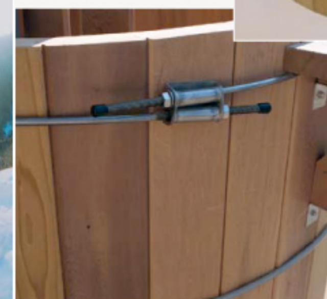
4. De ringen met koppellement voor het spannen van de duigen