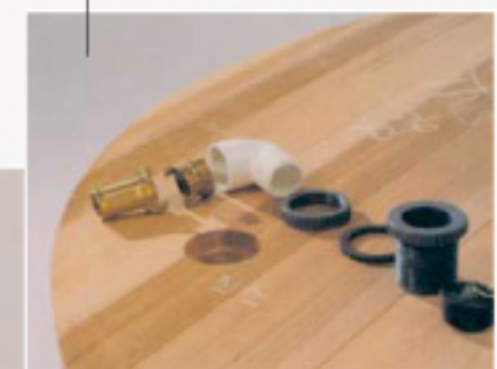
2. De afvoer en de stop