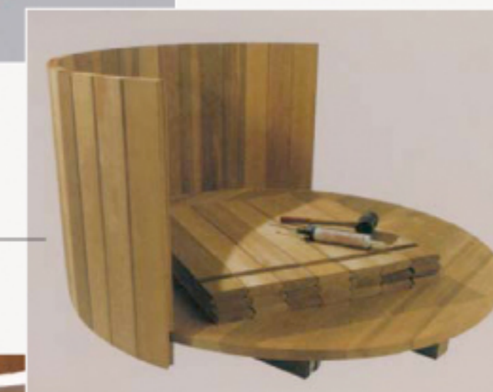
3. Het plaatsen van de duigen