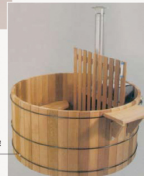
5. Het eindresultaat: binnen een dag (6 uur) heeft u uw Størvatt in elkaar gezet!