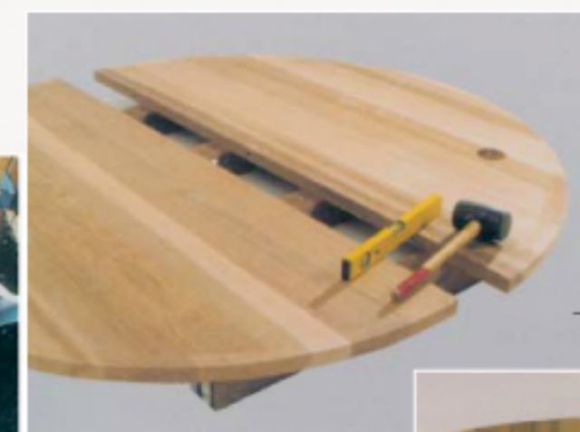
1. De twee bodemhelften en het frame